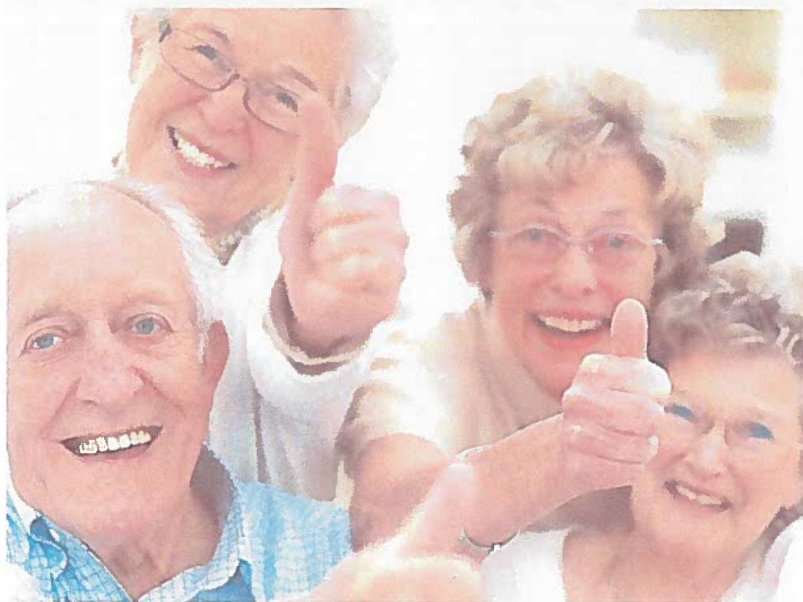
Zariadenie pre seniorov