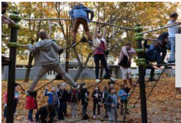
Otváranie detských ihrísk

Oddelenie stratégie a rozvoja Mestskej časti Košice - Sídliisko KVP v roku 2019 pripravilo v spolupráci s oddelením výstavby a majetku rozšírenie troch detských ihrísk a zriadenie nového venčoviska v hodnote 100.000,- €. Takisto sa spolupodieľalo na výmene a doplnení približne 60 -tich kusov nového mobiliáru.