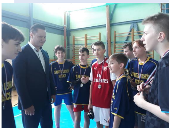
Turnaj o pohár Mestskej časti Košice - Sídlisto KVP vo futbale žiakov ZŠ 2. stupňa