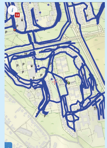
Naši aktívni pracovníci v teréne