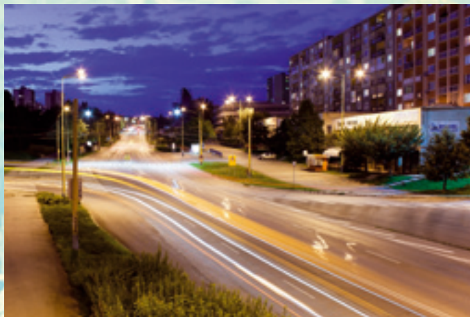
2. miesto - Tomáš Tkáčik Pokračovanie na strane 2.

Ukážka fotografií, ktoré sa umiestnili na ďalších miestach: