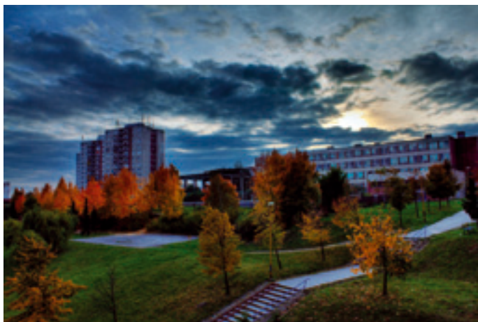
3. miesto – Miroslav Tomčík