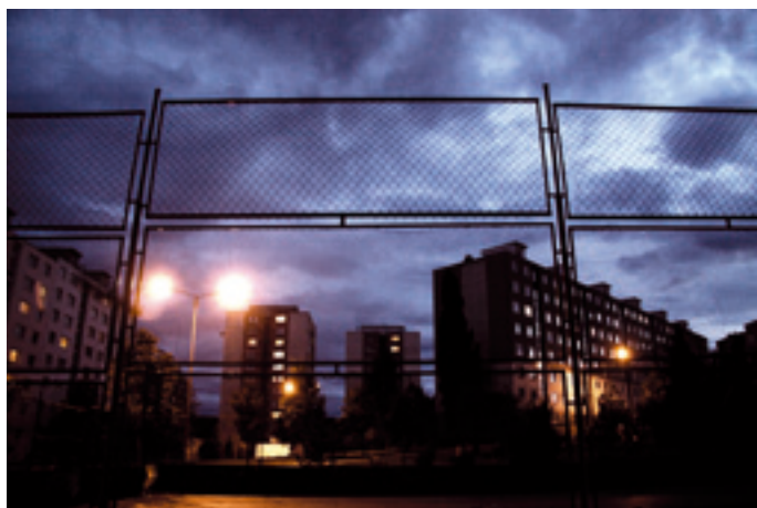
5. miesto – Nathan Šimčík