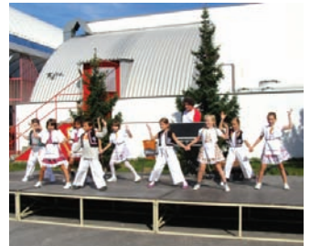
Eudový tanec v podaní detí z 3. ročníka zo Základnej školy Janigova