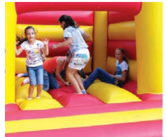
Úsmev na tvárach detí vyčaroval hlavne tento skákací hrad.

Nový školský rok nám opäť zaklopal na dvere, deti sa rozlúčili s prázdninami a 2. septembra opäť začali „šúchať“ školské lavice. Pri tejto príležitosti Mestská časť Košice – Sídliisko KVP v spolupráci s Komisiou kultúry, školstva a športu a OZ Laura pripravila pre deti dňa 9.9.2009 podujatie s názvom „Škola volá“.