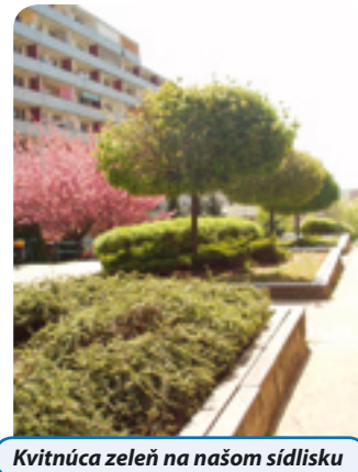
Kvitnúca zeleň na našom sídlisku