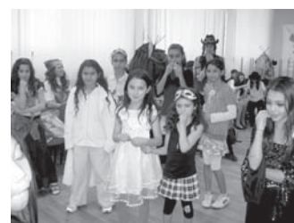
Počas jarných prázdnin sa konal prímestský tábor a deti

Jarné prázdniny sú už v cieľi, tak ako aj Willy Fog. Porazil lorda Sullivena v stávke o precestovaní sveta za 80 resp. 5 dní. Podarilo sa mu to vďaka piatim kmeňom z KVP. AINUOVAIA, ABO-RIGENCI, APAČI, MASAJOVIA a KELTI putovali po celom svete, aby získali dôkazy o návštevách všetkých kontinentov.