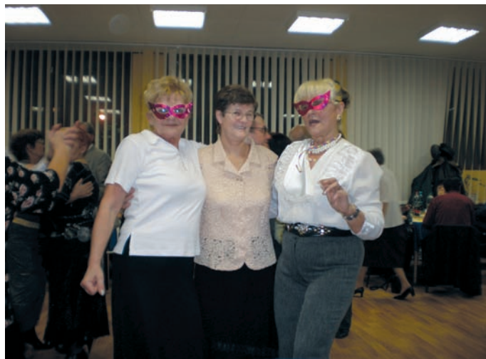
Aj takto sa zabávali členovia Senior klubu na Fašiangovej zábave v klubovom zariadení MČ.