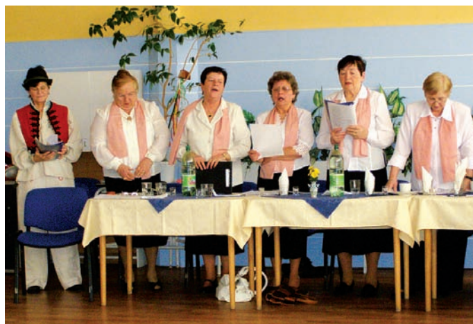
Členovia Klubu kresťanských dôchodcov sv. Jozefa na KVP si na fašiangovom posedení pripomenuli tradície z ich mladosti.

Lekáreň RADIX otvorená od 8.00-18.00 hod. sobota 8.00-12.00 hod.