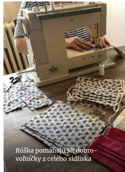
Rúška pomáhajú šiť dobrovoľníčky z celého sídliska

Ak nosíte dioptrické okuliare, zvolte rúško vystužené drôtom. Jednoduché rúško bez výstuže, nie je možné prispôsobiť krivkám tváre. Medzi lícami a rúškom tak vzniká priestor, cez ktorý si vzduch nadýchate priamo pod okuliare a preto máte neustále zarosené sklá.