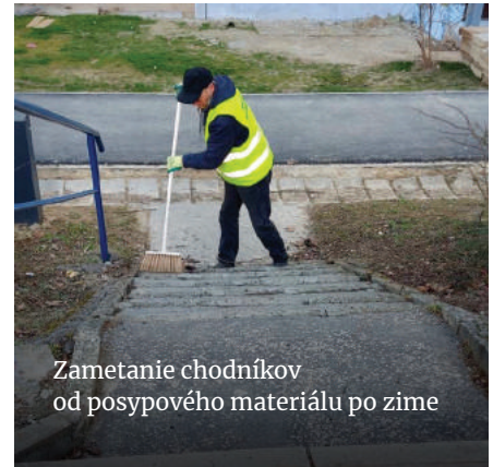
Zametanie chodníkov od posypového materiálu po zime