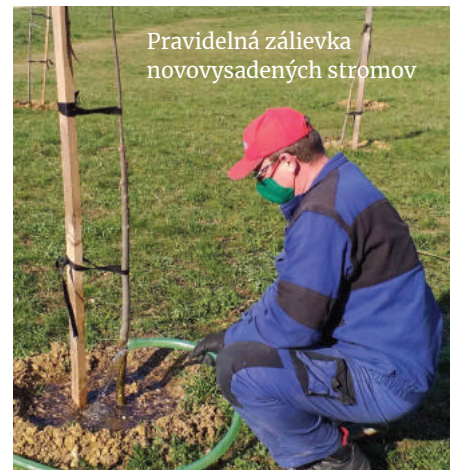
Pravidelná zálievka novovysadených stromov