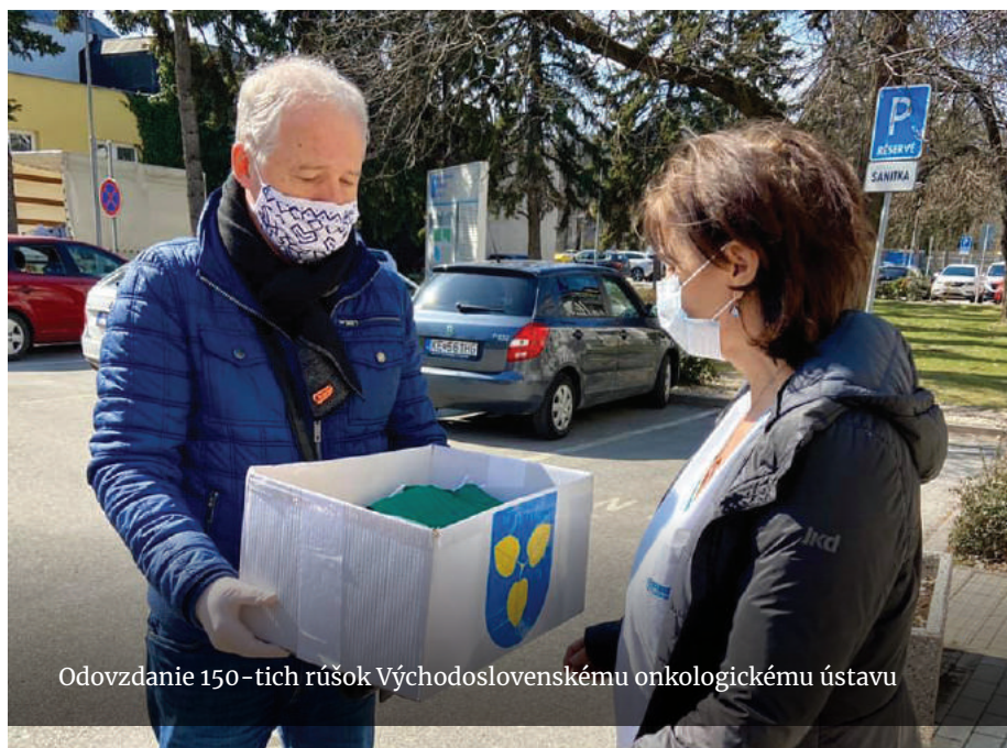
Odovzdanie 150-tich rúšok Východoslovenskému onkologickému ústavu