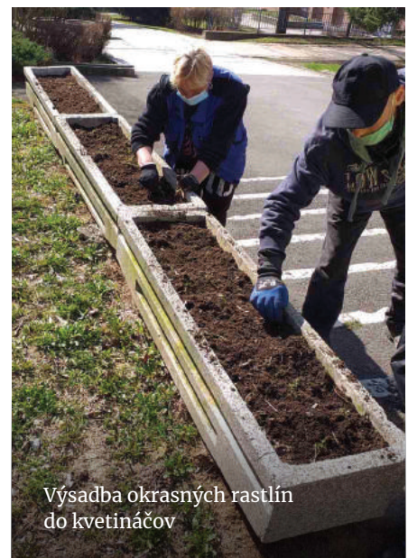
Výsadba okrasných rastlín do kvetináčov