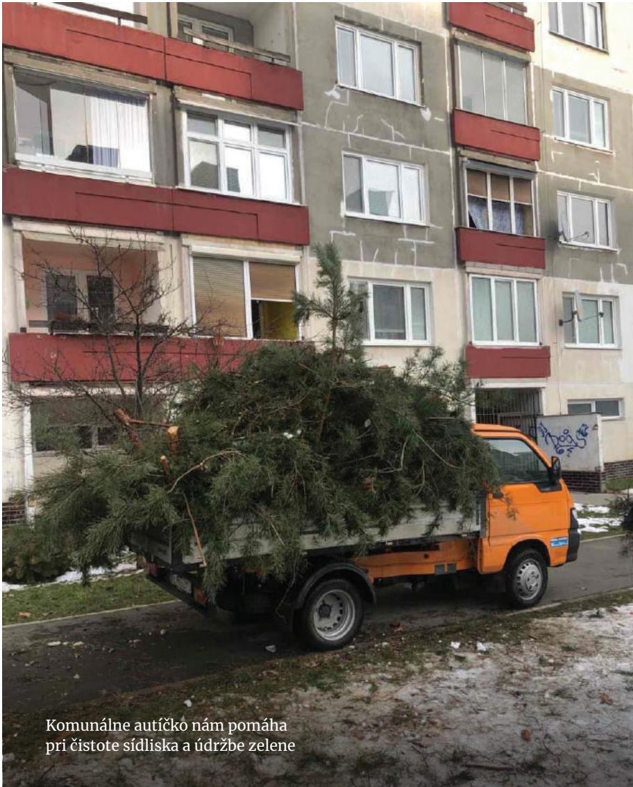
Komunálne autíčko nám pomáha pri čistote sídliska a údržbe zelene

Týždenný sumár toho, čo sa našim zamestnancom podarilo urobiť v teréne, aby bolo naše sídlisko čistejšie, nájdete vždy v pondelok ráno na oficiálnom FB profile mestskej časti: Mestská časť Košice - Sídlisko KVP .