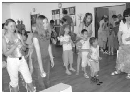
V tomto roku sa „Deň detí“ pre deti zo sociálne slabších, neúplných a viacdenných rodín uskutočnil 02. 06. 2008.

Plánované odstávky dodávky tepla z CZT Košice v roku 2008 na základe oznámenia dodávateľa tepla TEKO a.s. Košice