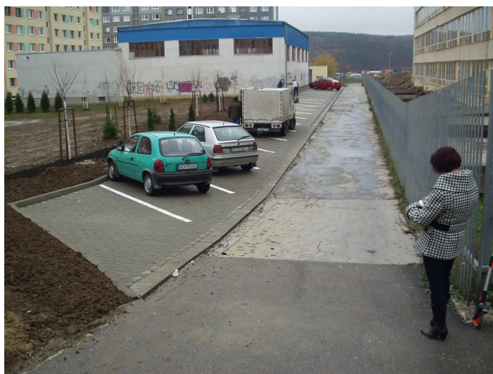
Novovytvorené parkovisko so sadovými úpravami pri Spojenej škole sv. košických mučeníkov na Čordákovej ulici (druhá fáza sadových úprav prebehne v roku 2010)