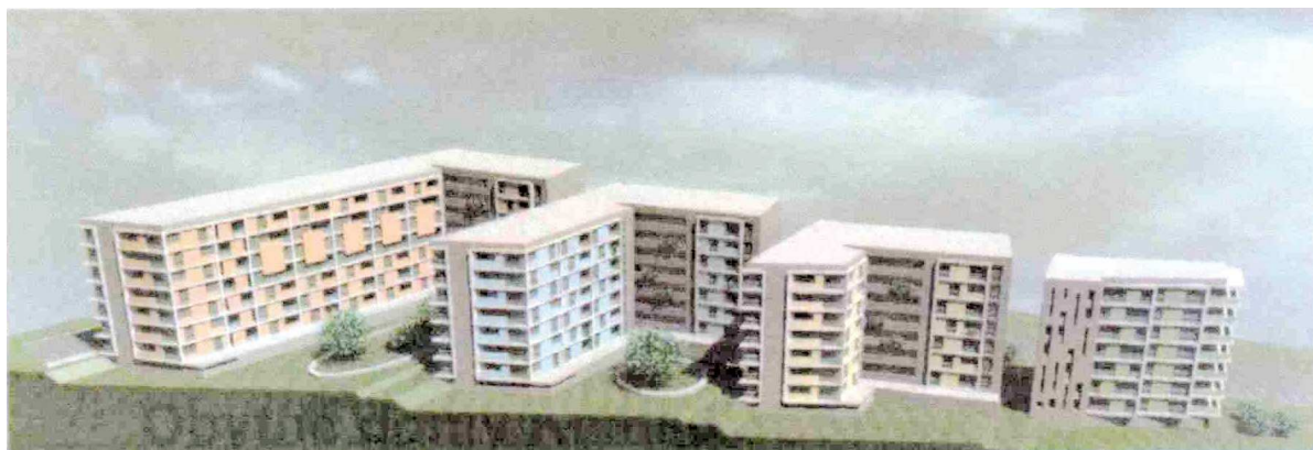
Plán obytných súborov Grot, z ktorých prvá z uvedených budov bola dokončená v roku 2009