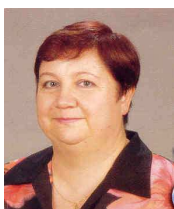
Alžbeta Bukatová - SMER-SD