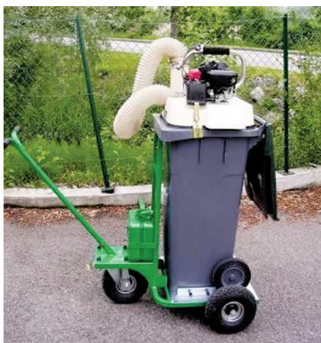
Vysávač na experimenty zakúpený v roku 2009