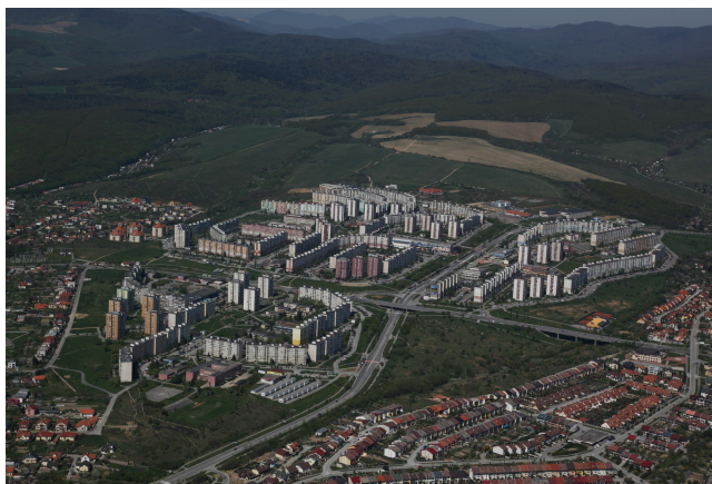
Letecký záber sídliska KVP

Rok 2009 bol významný hlavne z pohľadu počtu volieb. Uskutočnili sa až troje, a to voľby do Európskeho parlamentu, voľby prezidenta SR a voľby do samosprávnych krajov. Táto kronika obsahuje súhrnné údaje o kandidátoch, zvolených kandidátoch a percentuálnej účasti.